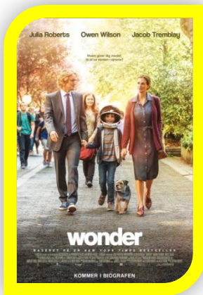
1 time 55 min. 20.1.2019