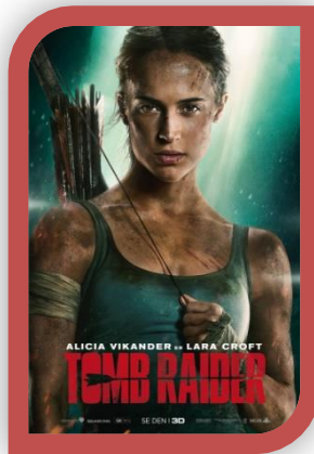
2 timer 10.3.2019