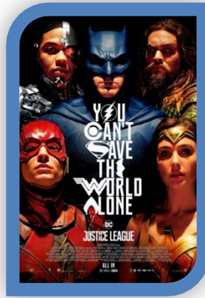
2 timer 05 min. 28.10.2018