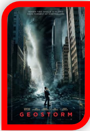
1 time 55 min. 23.9.2018