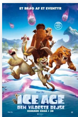
1 time 40 min. 25.2.2017