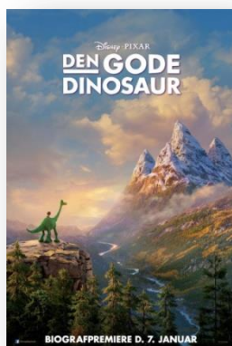
1 time 35 min. 5.11.2016