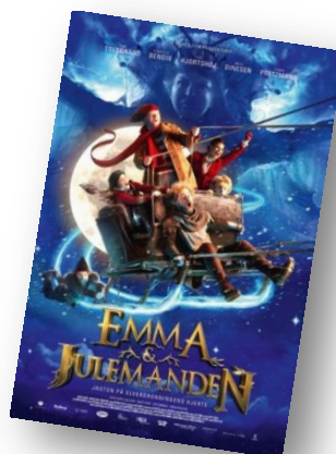
1 time 35 min. 3.12.2016

HUSK at udfylde snipperne "TIL FILMKLUBBEN" og "TIL DIG" nederst på siden, og at aflevere snippen "TIL FILMKLUBBEN" til De Blå Damer i biografen.