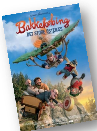
1 time 25 min. 21.1.2017

HUSK at udfylde snipperne "TIL FILMKLUBBEN" og "TIL DIG" nederst på siden, og at aflevere snippen "TIL FILMKLUBBEN" til De Blå Damer i biografen.