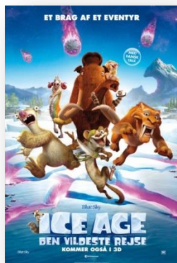
1 time 40 min. 26.2.2017