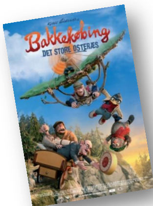
1 time 25 min. 22.1.2017

HUSK at udfylde snipperne "TIL FILMKLUBBEN" og "TIL DIG" nederst på siden, og at aflevere snippen "TIL FILMKLUBBEN" til De Blå Damer i biografen.