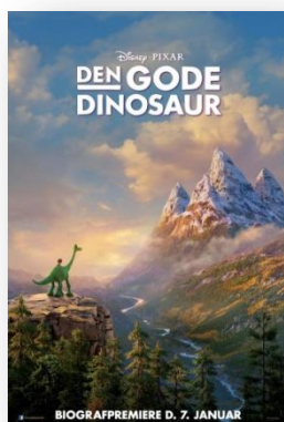
1 time 35 min. 6.11.2016