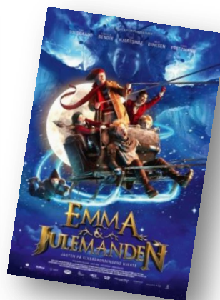
1 time 35 min. 4.12.2016

HUSK at udfylde snipperne "TIL FILMKLUBBEN" og "TIL DIG" nederst på siden, og at aflevere snippen "TIL FILMKLUBBEN" til De Blå Damer i biografen.