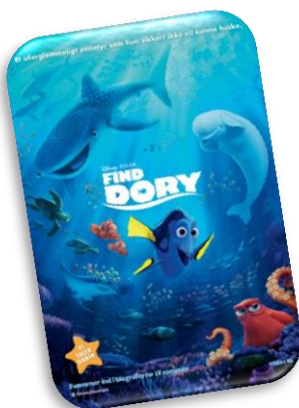
1 time 40 min. 23.9.2017