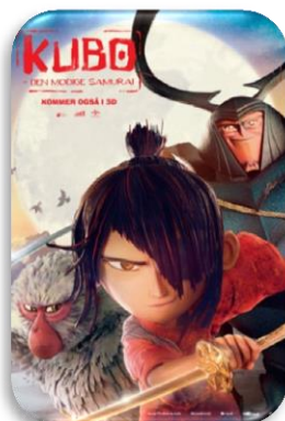
1 time 40 min. 4.11.2017