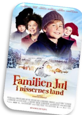
1 time 40 min. 2.12.2017