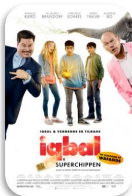
1 time 25 min. 10.3.2018