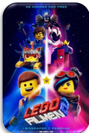
1 time 40 min. 2.11.2019