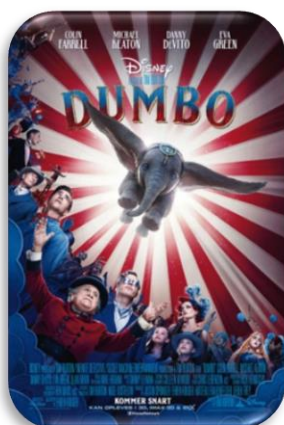
1 time 55 min. 18.1.2020