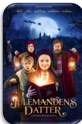
1 time 30 min. 30.11.2019