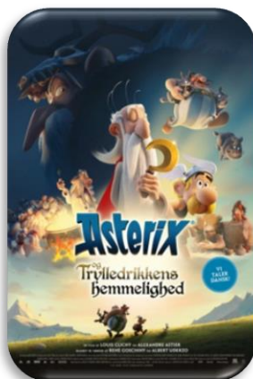
1 time 25 min. 29.2.2020